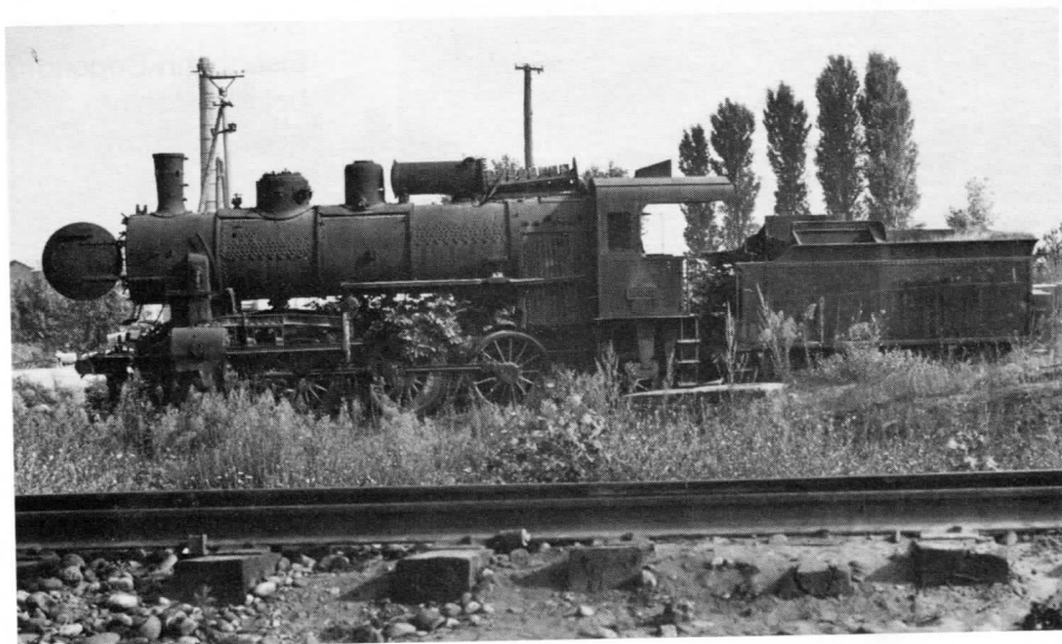
S 42 Shkozet Lok 324.504