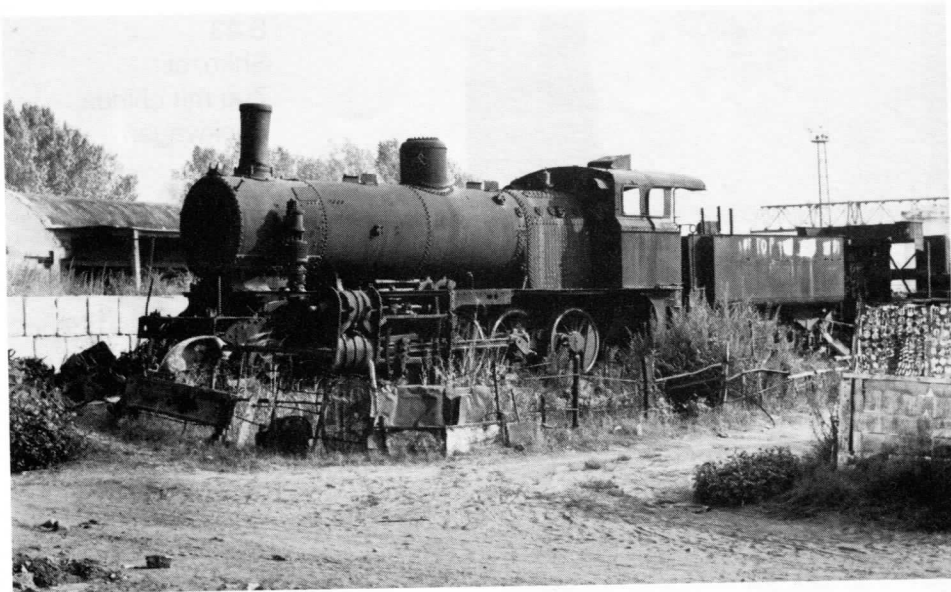
S 41 Shkozet Lok 56 3408